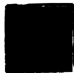
zorničky zobák ušetřeno.